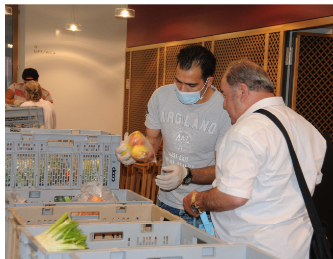
Lebensmittelausgabe beim Imbiss Hope